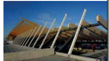
Halle 10 Landesmesse Stuttgart