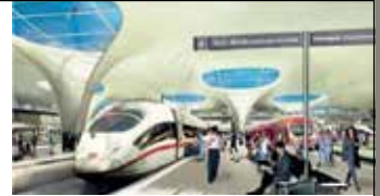
Stuttgart 21 Talquerung (in Arge)